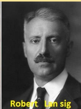
Robert Lan sig

Comitetului Național Ceh. Peste o zi, aderă și oamenii politici slovaci la Declarația de la